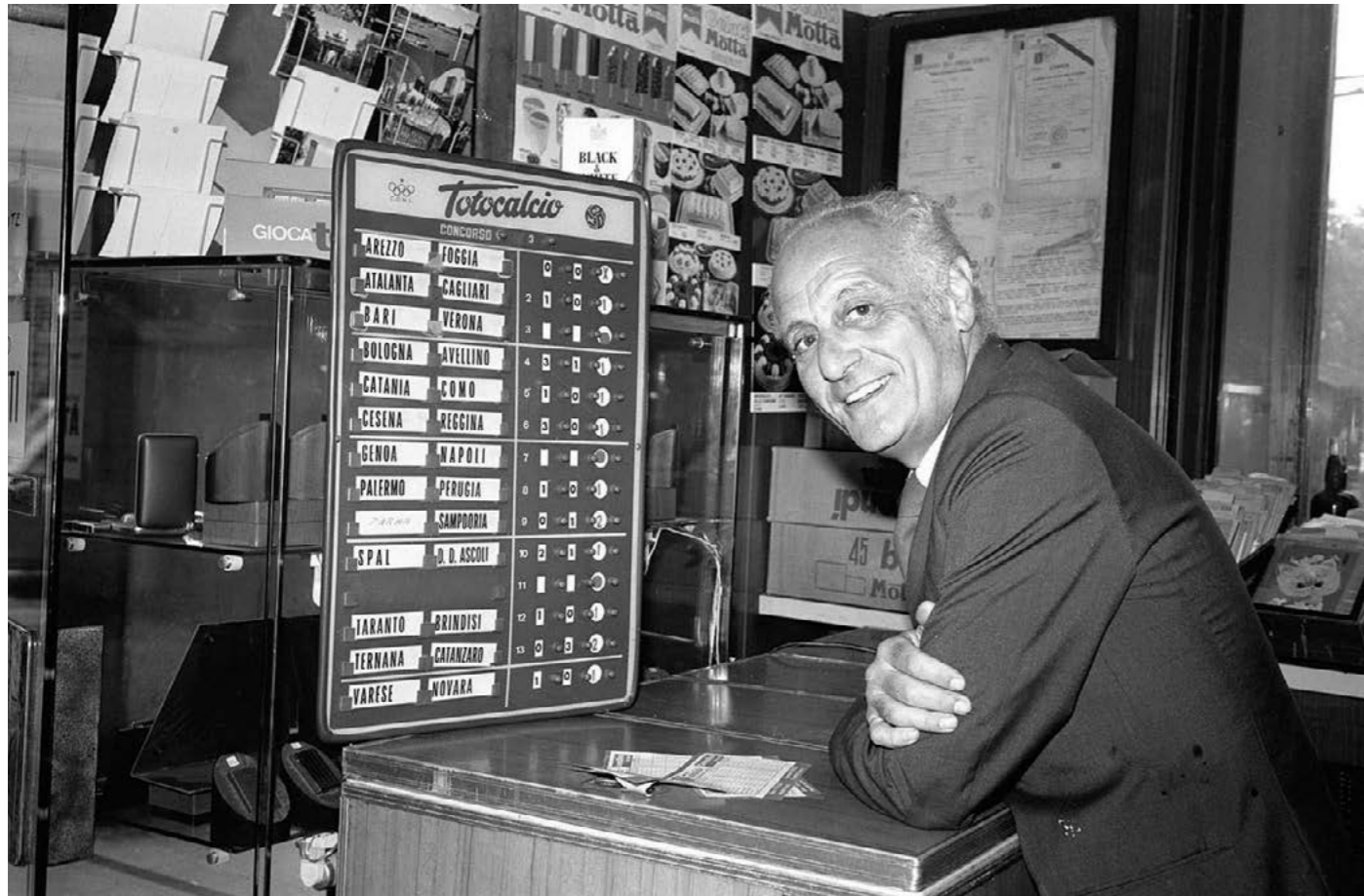
L'inventore del Totocalcio, il giornalista Massimo Della Pergola, in una ricevitoria di Milano (1973)

nell'Articolo 1 del proprio statuto propugnava 'la difesa e il potenziamento della razza italiana', motto che era palesemente in aperto contrasto che il nuovo modo di pensare e di intendere degli italiani che prendevano istericamente le distanze da tutto quello in cui avevano creduto per vent'anni e oltre.