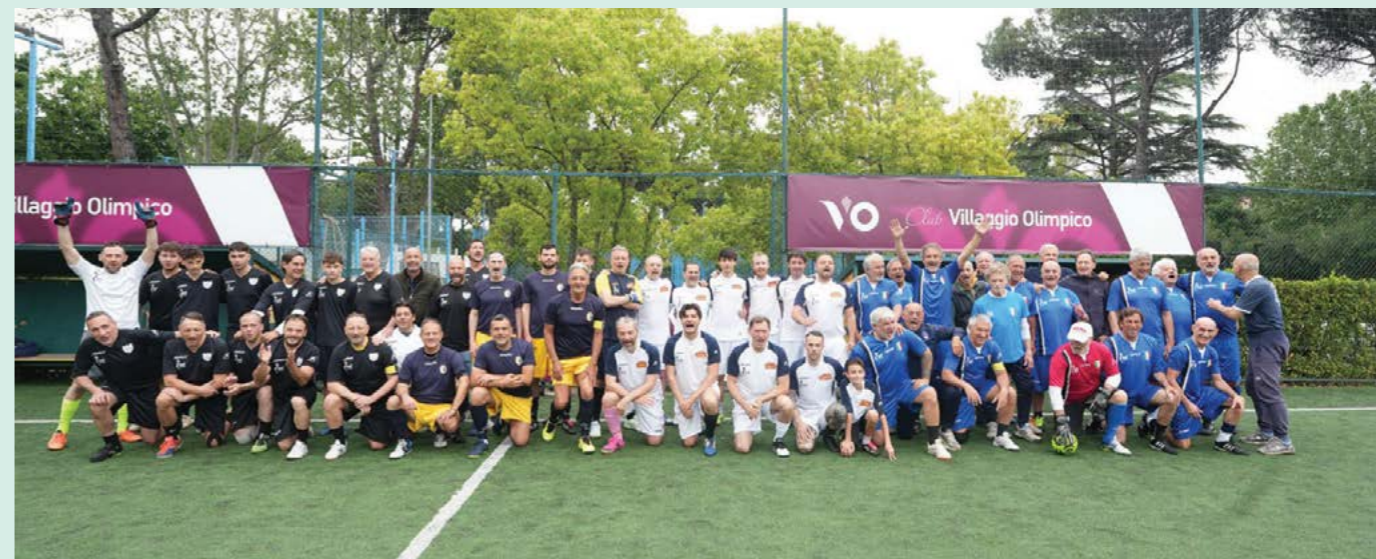
Foto di rito per le squadre partecipanti