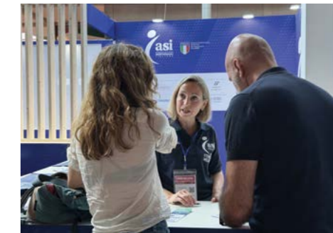
Lo stand di ASI all'ingresso della fiera

to globale. In questo contesto, ASI non è un ospite: è un attore strutturale del settore.