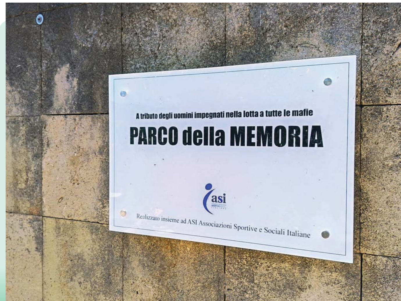
Proprio sotto il tratto di strada dove è avvenuta la strage a Capaci, c'è oggi il Parco della Memoria. ASI è presente