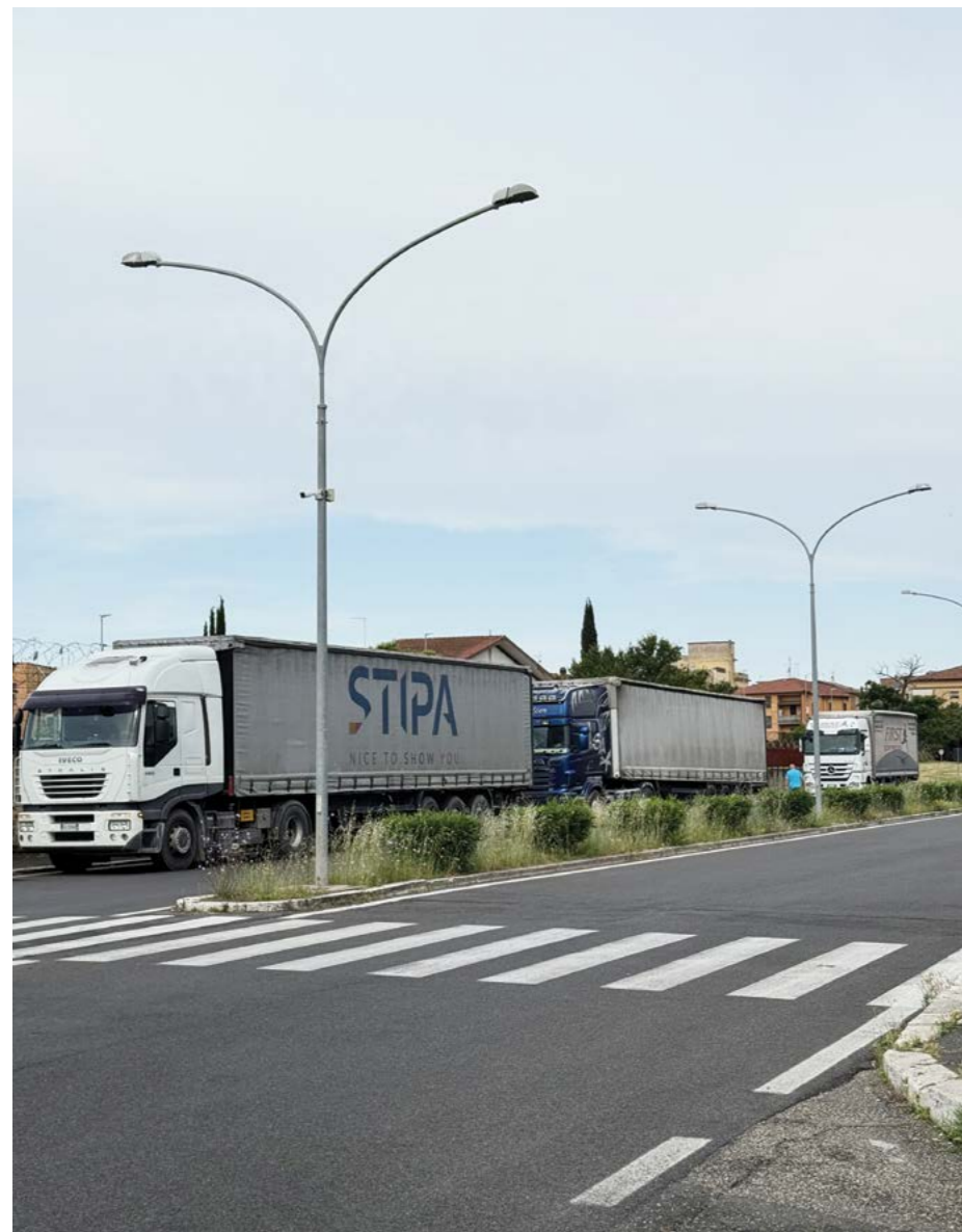
Foto a sinistra: L'arrivo dei tir con i macchinari sportivi Foto sotto: L'ingresso del materiale

percorso radicato nel tempo di impegno di ASI verso la divulgazione dell'attività sportiva all'interno delle aree carcerarie. Lo sport e l'attività fisica sono infatti strumenti fondamentali di crescita personale, equilibrio psicofisico e inclusione sociale, soprattutto all'interno di un contesto complesso come quello carcerario, in cui poter praticare esercizio fisico significa promuovere stili di vita sani, favorire la disciplina, il rispetto delle regole e il benessere individuale in una forza ancora maggiore: una parte delle attrezzature è stata destinata alle aree G8, G9 e Venere (riservate ai detenuti) ed un'altra invece proprio agli agenti impegnati all'interno della Casa Circondariale.