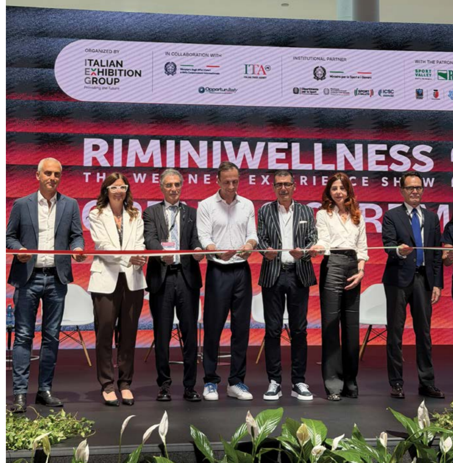
Il nostro Presidente al taglio del nastro della manifestazione

to della sostenibilità un tema strutturale, non un'etichetta da apporre sul comunica-