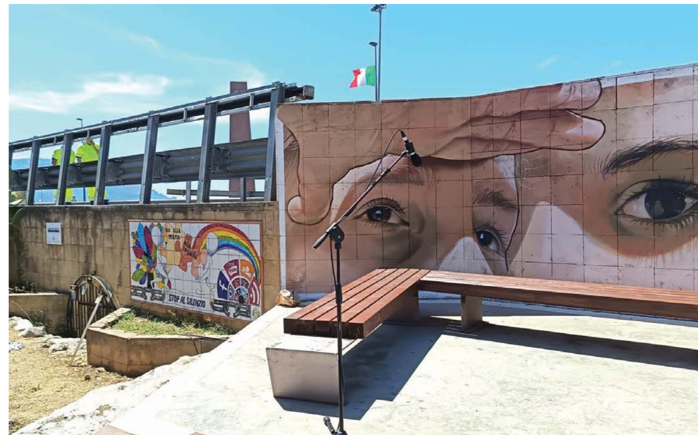
Nel luogo della strage c'è oggi un parco. Per non dimenticare