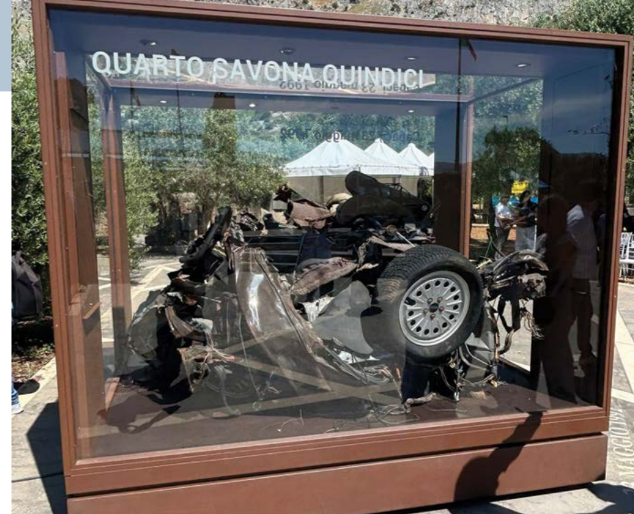
Una teca, con la macchina del giudice Falcone

Un luogo di rinascita. Trentaquattro anni dopo la strage che uccise il giudice Gio-