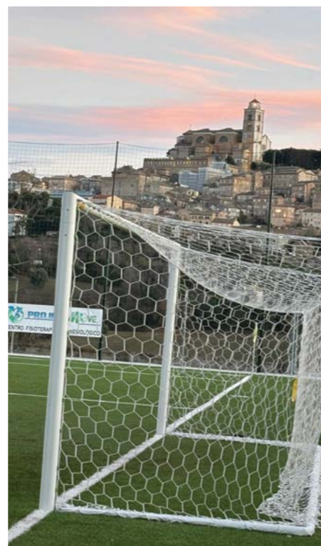
Lo stadio della Fermana e sullo sfondo la città storica di Fermo

dare forza all'iniziativa, trasformando una semplice affiliazione in un laboratorio di innovazione educativa e sportiva, capace di incidere concretamente sul territorio marchigiano.