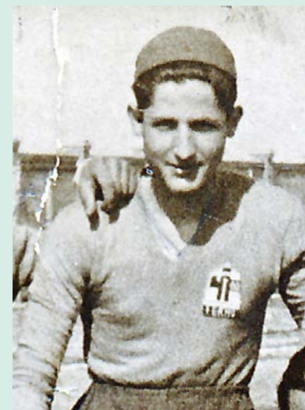
Elvio Matè è il più prestigioso calciatore fermano. Nasce sul Colle Sàbulo nel novembre 1921 e inizia la sua carriera calcistica in quello che è stato il primo e più famoso vivaio della Fermana: i "Pulcini di Hajos", così chiamati dal nome dell'allenatore (l'ex nazionale ungherese Arpad Hajos) che nel 1934/36 guidava contemporaneamente sia la prima squadra che le giovanili