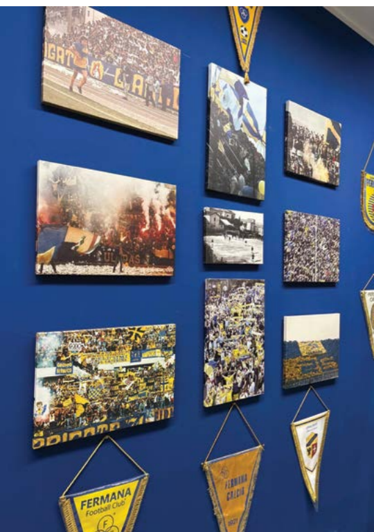
L'entusiasmo dei tifosi sulle pareti dello stadio

fondamentali di un sistema educativo che utilizza lo sport come strumento, ma non come unico fine.