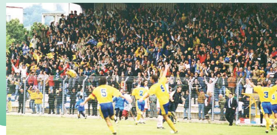
Miracolo Fermana: l'indimenticabile promozione in Serie B del 1999